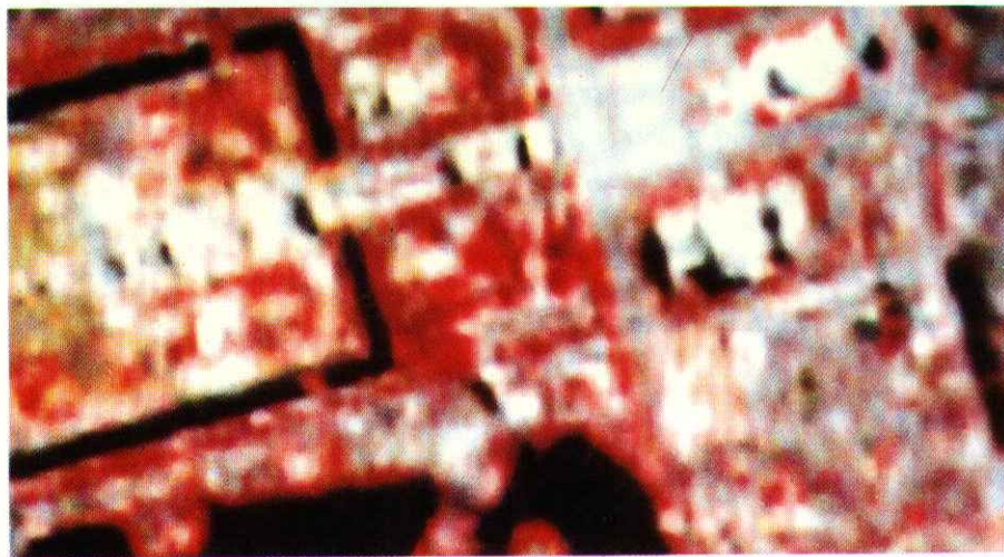
图1 TM2,3,4 波段重采样后的彩色合成图像 (波段 2 = 蓝, 波段 3 = 绿, 波段 4 = 红)